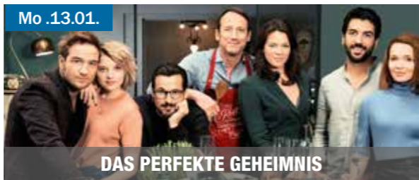
Mo .13.01. DAS PERFEKTE GEHEIMNIS

Deutschland 2019 • Regie: Bora Dagtekin Darsteller: Elyas M'Barek, Florian David Fitz, Jella Haase Drei Frauen (Karoline Herfurth, Jella Haase, Jessica Schwarz) und vier Männer (Elyas M'Barek, Florian David Fitz, Frederick Lau, Wotan Wilke Möhring): Jeder hat ein Handy, das macht insgesamt sieben Mobiltelefone. Als die Freunde eines Abends zum Essen zusammenkommen, kommt ihnen plötzlich eine Idee. Sie spielen ein Spiel: Jeder legt sein Handy in die Mitte des Tisches und ganz egal, wer nun welche Bilder oder Nachrichten geschickt bekommt, und seien sie noch so kurz - alles muss mit den anderen geteilt werden. Telefonate sind nur über den Lautsprecher erlaubt.