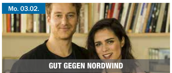
Mo. 03.02. GUT GEGEN NORDWIND