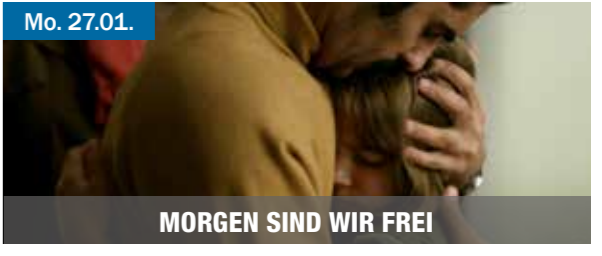
Mo. 27.01. MORGEN SIND WIR FREI