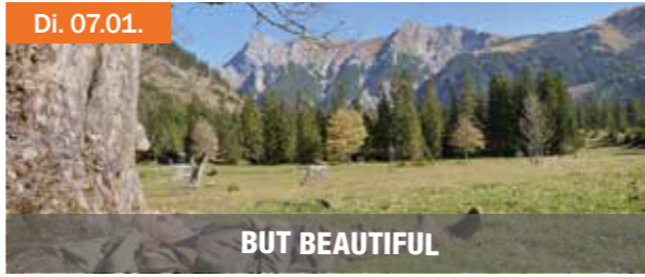
Di. 07.01. BUT BEAUTIFUL

Deutschland, Österreich 2019 Regie: Erwin Wagenhofer In seinem Dokumentarfilm beschäftigt sich der Filmemacher Erwin Wagenhofer mit Menschen, die noch einmal einen ganz neuen Weg einschlagen. Viel zu oft haben wir davor Angst, etwas Neues zu wagen und träumen stattdessen nur von einem neuen, komplett anderen Leben. Doch es gibt sie, die Menschen, die den Sprung ins Ungewisse wagen, ganz ohne Netz und doppelten Boden. Sie trauen sich in eine neue Zukunft, ohne vor ihrer Angst oder Vorbehalten zu haben. Wie soll so ein neues Leben eigentlich aussehen und ist die Verwirklichung eines solchen überhaupt möglich?