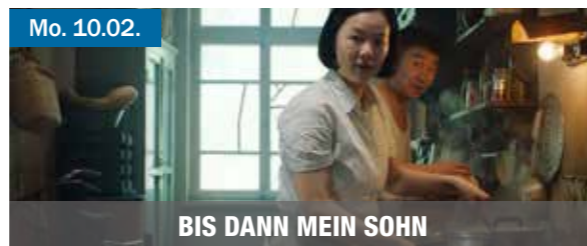
BIS DANN MEIN SOHN

China 2019 • Regie: Wang Xiaoshuai Darsteller: Wang Jing-chun, Yong Mei, Qi Xi