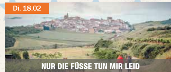
NUR DIE FÜSSE TUN MIR LEID