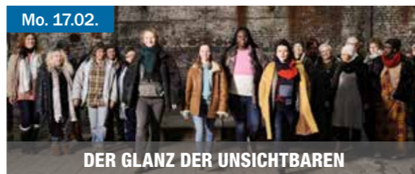
DER GLANZ DER UNSICHTBAREN