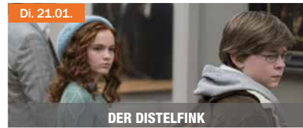
Di. 21.01. DER DISTELFINK