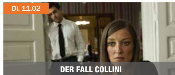
DER FALL COLLINI

Deutschland 2019 • Regie: Marco Kreuzpaintner Darsteller: Elyas M'Barek, Alexandra Maria Lara