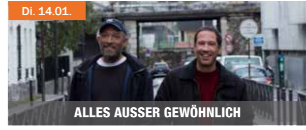
Di. 14.01. ALLES AUSSER GEWÖHNLICH