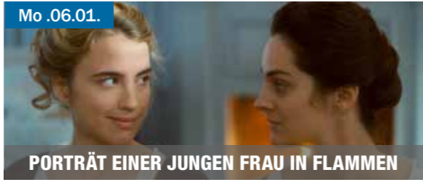
Mo .06.01. PORTRÄT EINER JUNGEN FRAU IN FLAMMEN