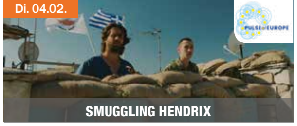
Di. 04.02. SMUGGLING HENDRIX